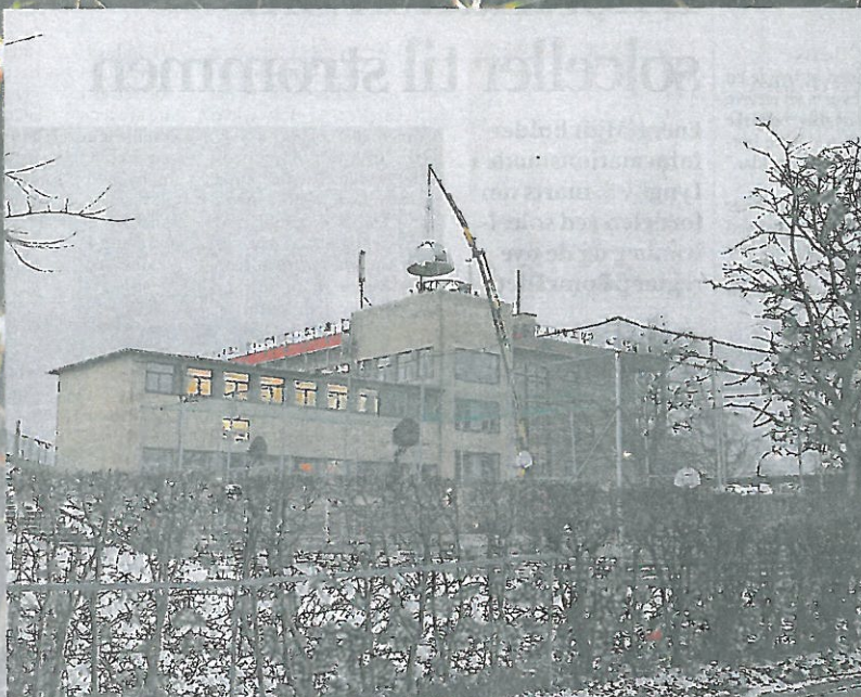
Selve kuplen på Bakkegårdsskolens observatorium har været til reparation hen over vinteren. Her tager en stor kran kuplen ned fra skolens trappetårn.